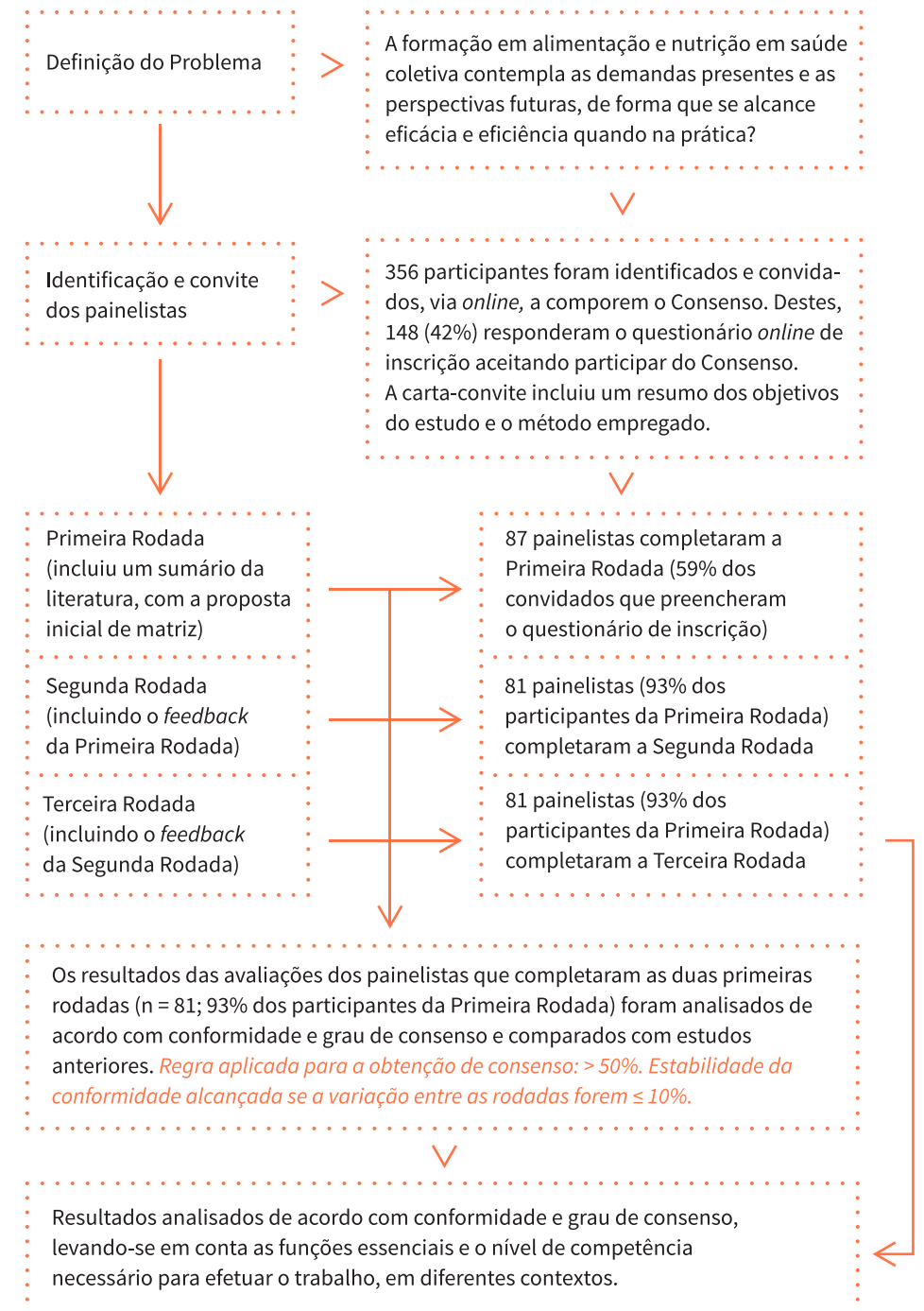
Figura 1: Panorama do processo Delphi

A literatura não apresenta nenhum padrão de concordância a respeito de como mensurar consenso (14–15, 34–37). Empiricamente, o consenso é determinado pela medida da variabilidade nas respostas dos participantes, nas diferentes rodadas por técnica Delphi, onde a redução na variabilidade pode indicar que um maior consenso foi alcançado. Outros métodos têm sido utilizados, incluindo a contagem de mudanças por rodadas \leq 10\% entre as respostas dos participantes como indicativo de estabilidade de consenso (concordância) (4–9). Neste estudo o padrão arbitrário inicial de consenso foi de 50% (ou seja, pela maioria) para as três rodadas. Este padrão tem sido utilizado em estudos prévios internacionais sobre habilidades e competências em nutrição em saúde coletiva (4–12).